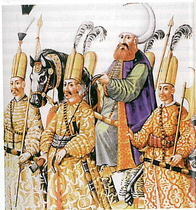
A török hadsereg parádéja

Ezt nem kellett volna. Nem mintha Konstantinápoly nem tett volna már ehhez hasonlót, de itt mégis egy török diplomatáról volt szó.