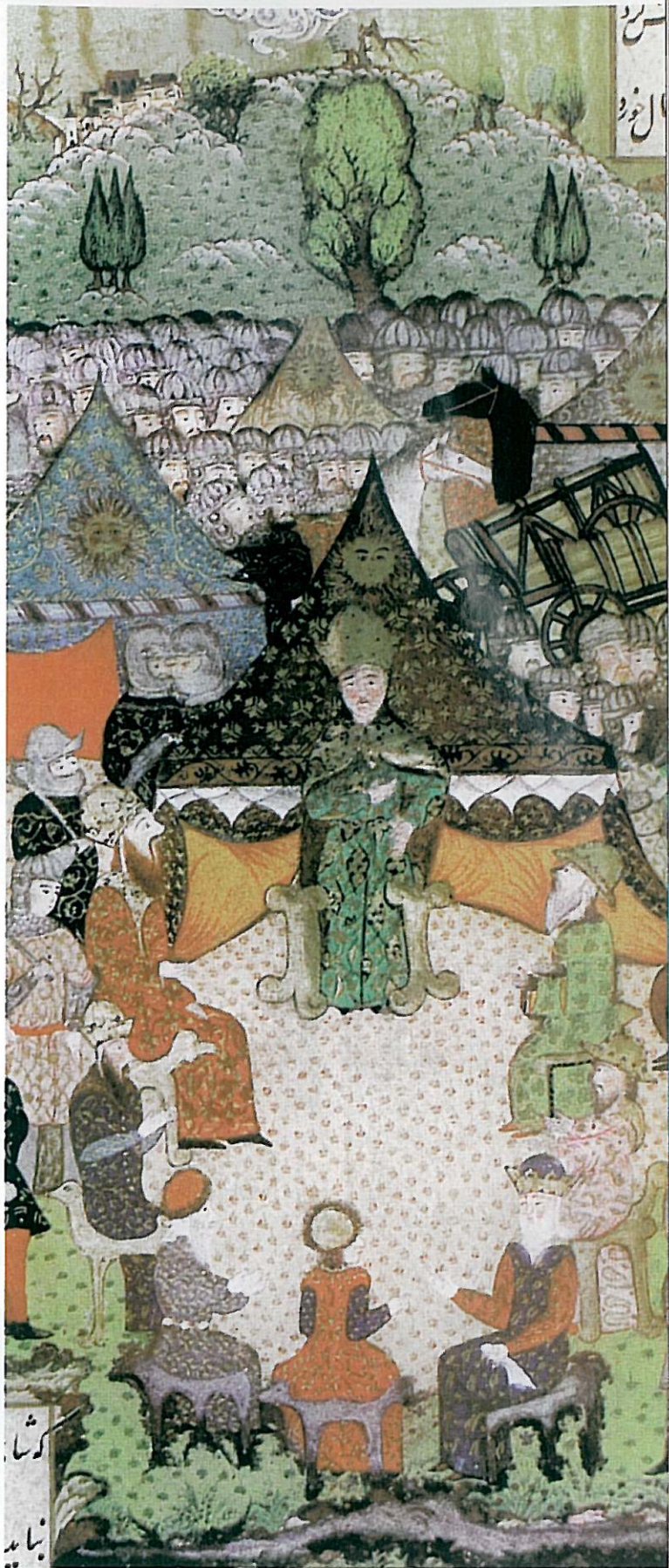
II. Lajos haditanácsa a mohácsi csata előtt

1541 Mohács óta nagyot fordult a világ. 1538-ban Váradon békét köt I. Ferdinánd magyar és I. (Szapolyai) János magyar király – ami azért mindent elárul az akkori viszonyokról. Több történész egybehangzó véleménye, hogy kevés állam süllyedt ilyen kacagató fintorokkal a történelem temetőjébe. A megegyezés